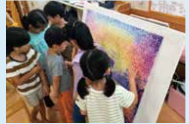
教員向けワークショップの様子